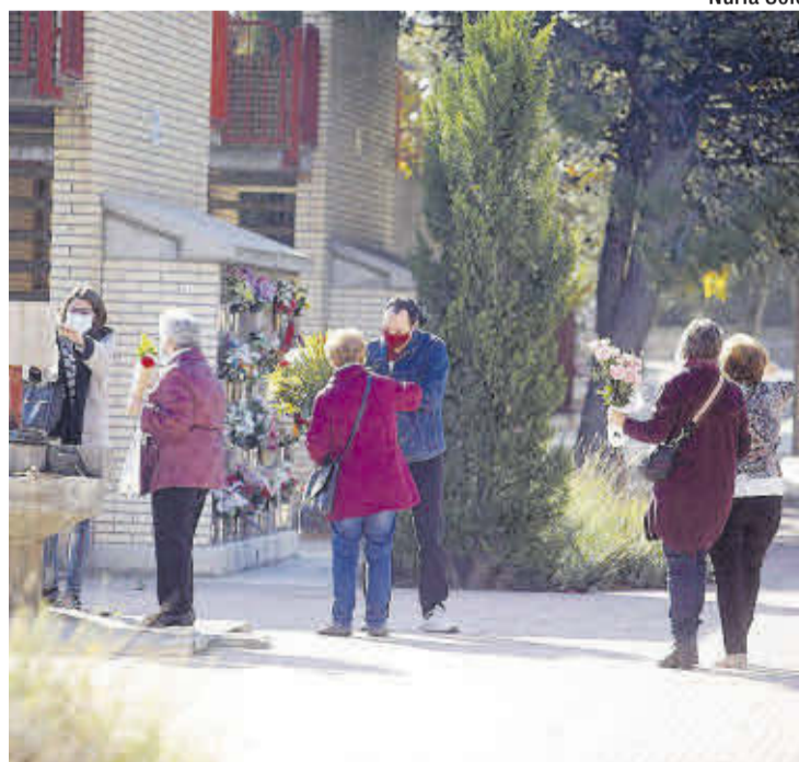
Con flores. Unas personas visitan a sus seres queridos en el cementerio.

Además, estos días hay en el cementerio de Torrero otras actividades como visitas guiadas. También se han hecho unos cuentos para explicar la muerte a los niños.